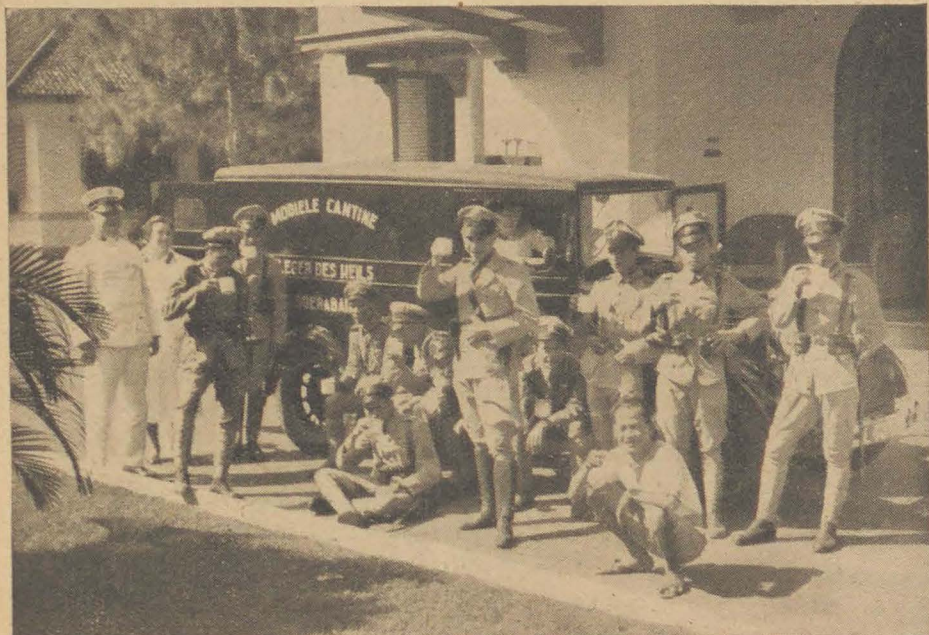
De koffie smaakt goed.

Onder dezen titel vertelden wij in een vorig nummer iets van den arbeid door het Leger des Heils in deze gewesten verricht in verband met de huidige bijzondere diensten, welke gevraagd worden van de militaire en politie-machten, alsook over het hulpverleen aan de oorlogsslachtoffers.