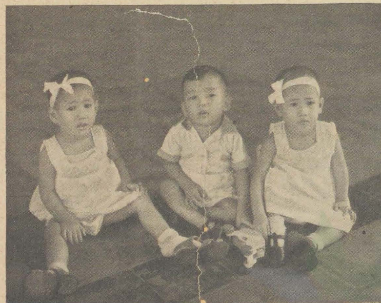
DRIE KLEUTERS UIT HET INHEEMSCH KINDERHUIS TE MEDAN.

Wat zou het voor de moeder gemakkelijk geweest zijn haar jongen te helpen, doch ze miste haar kans.