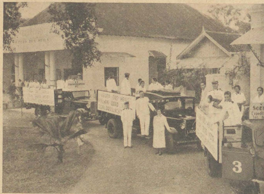
De vrachtauto's op het punt om uit te rijden.

schen. Toen er echter vele maanden voorbij gingen zonder dat hij terug kwam, begonnen de menschen hem te vergeten. De oude man echter was dag en nacht doorgewandeld tot hij in een groot bosch kwam. Hier deed hij zijn kleeren uit en trok een groot wolfsvel aan. Toen koos hij zich een hollen boom tot woning, zette zich ervoor neer, en begon te lezen in een dik boek, dat hij onder zijn nieuwe „kleeding” verborgen had en begon te spreken.